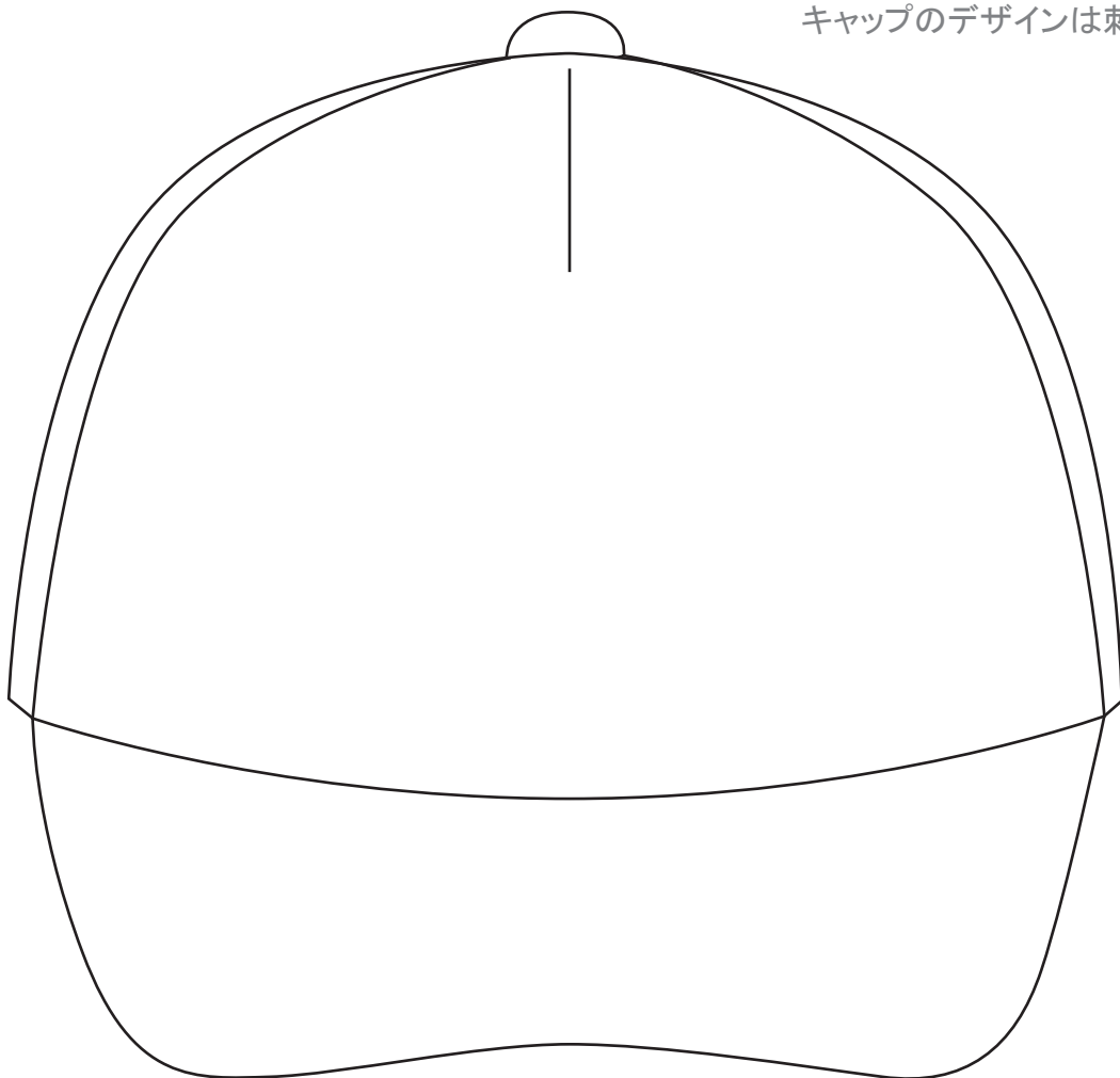
FRONT SIDE (最大110×55mm)